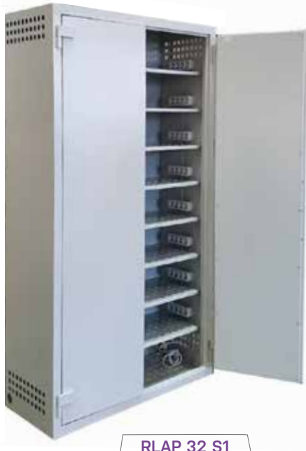
RLAP 32 S1