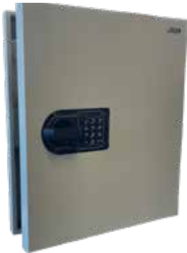
I KEY 55

L'armoire à clefs I-Key permet d'organiser et de protéger du vol les clefs. Fabriquée en Europe, elle est fournie avec des portes-clefs individuels et un repérage numéroté. Excellent positionnement prix/produit.