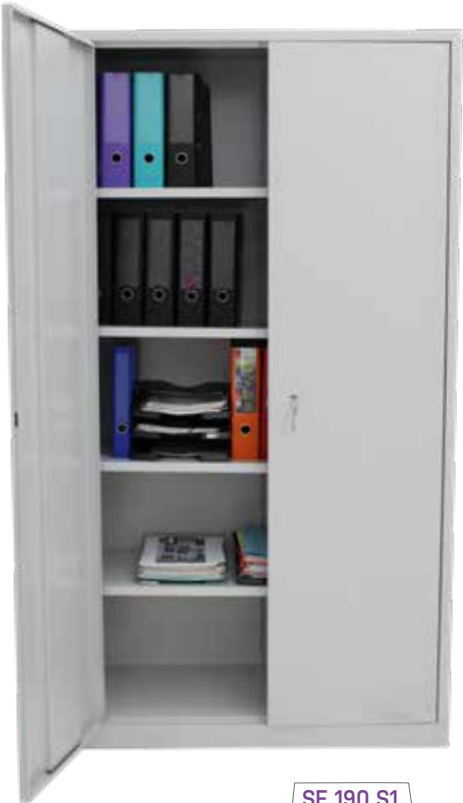
SE 190 S1