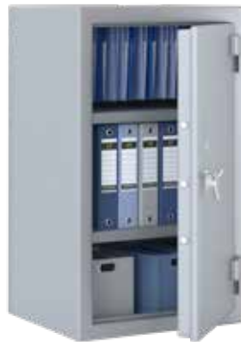
SR 100 S1

• Sécurisez vos documents et protégez-les du vol