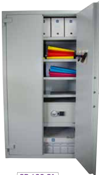
SR 400 S1