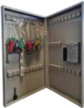
I KEY 55

• Sécurisez vos clefs et protégez-les du vol