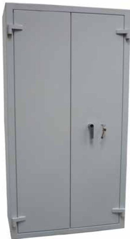
FO 600 S1

• Sécurisez vos documents et protégez-les du vol