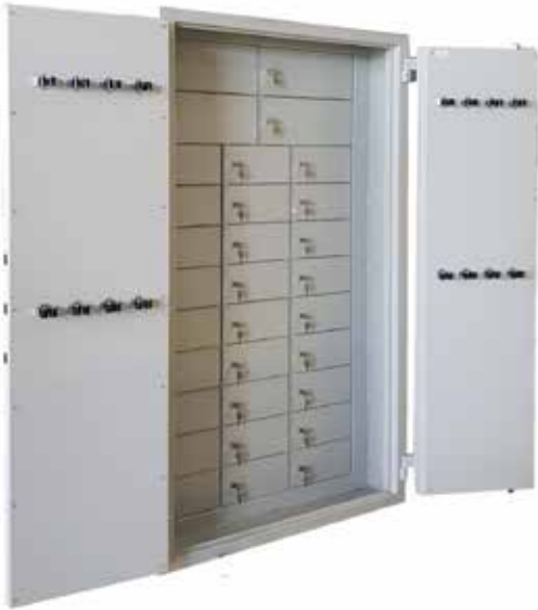
RP 530 S4