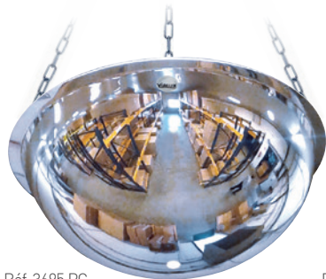
Réf. 3695 PC