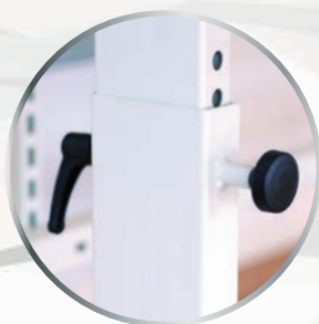
Réglage par indexeur au pas de 25 mm