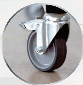
Option pieds avec roulettes pivotantes ø75 ou 125 mm.