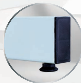
Vérins de mise à niveau.