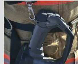
3 points de fixation pour mousqueton