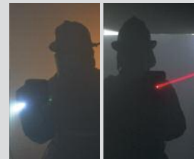
Lampe de poche/ pointeur laser