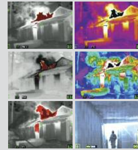
Six palettes de couleurs