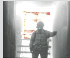
Image de base en couleur