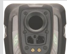
Lentille germanium remplaçable sur le terrain