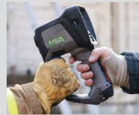
Modèle à deux poignées breveté