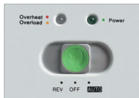
Interrupteur multi-fonctions et témoin de fonctionnement