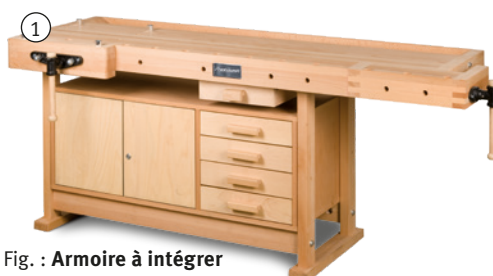
Fig. : Armoire à intégrer

Suggestion d'équipement du coffre basculant: Ciseau 6 - 30 mm (cerisier), jeu de tournevis, grande lime demi-ronde, grande râpe demi-ronde, foret pointu, alésoir, racloir, rabot à feuillure jumelé, double rabot, pierre à aiguiser, marteau métallique 300 g, lime métallique plate, boîte de forets, lime ronde Ø 10 mm, lime triangulaire, chasse-goupilles 3 et 5 mm, rabot de lissage, rabot long 480 mm, fausse équerre en hêtre, gabarit d'onglet en hêtre, équerre de 25 cm, scie japonaise, rapporteur, trusquin à tracer, tenailles. Equipement non fourni