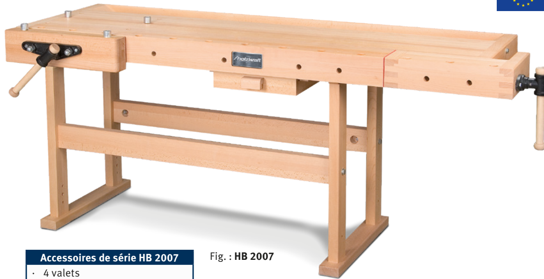
Fig. : HB 2007