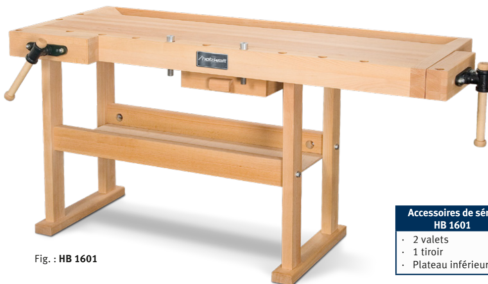
Fig. : HB 1601