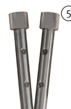
Fig. : Jeu de valets ronds longs