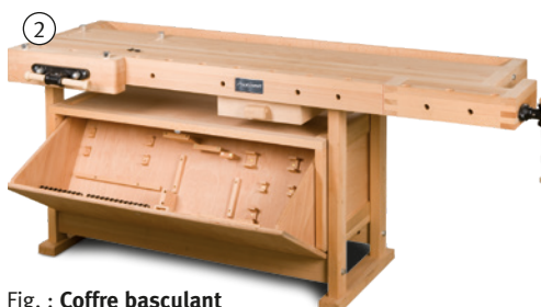
Fig. : Coffre basculant