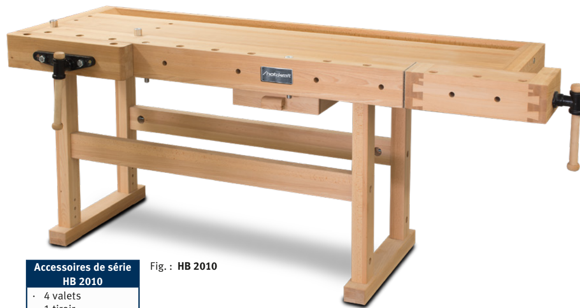
Fig. : HB 2010