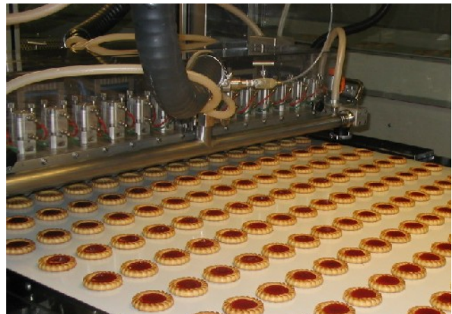
version dépose par manifold pressurisé