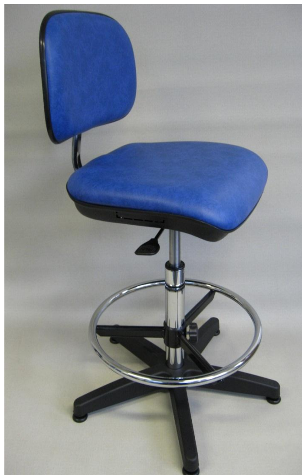
Visuel du siège N23 avec repose-pieds RPTL

Efficacité contre les bactéries (MRSA) : traitement qui combine différents agents bactéricides et fongicides (certificat Sanitized)