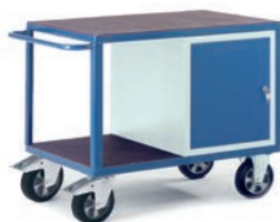
Etabli charges lourdes avec 1 caisson porte