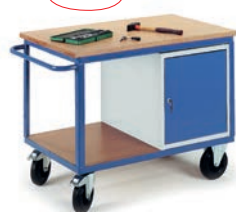
Etabli mobile avec 1 caisson porte