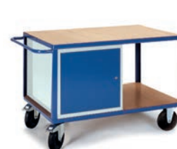
Etabli mobile avec 1 caisson porte et 1 caisson 4 tiroirs