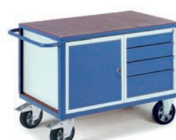
Etabli charges lourdes avec 1 caisson porte et 1 caisson 4 tiroirs