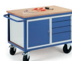
Etabli mobile avec 1 caisson porte + 1 caisson tiroirs