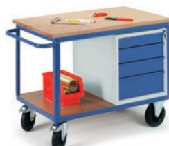
Etabli mobile avec 1 caisson 4 tiroirs