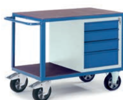
Etabli charges lourdes avec 1 caisson 4 tiroirs