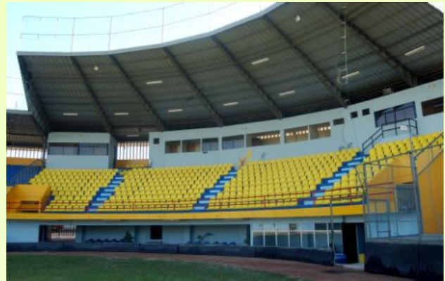
Modèle CR4 Siège avec dossier simple paroi de 35 cm de haut