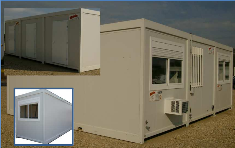
Exemples de modules Vestiaire & Réfectoire