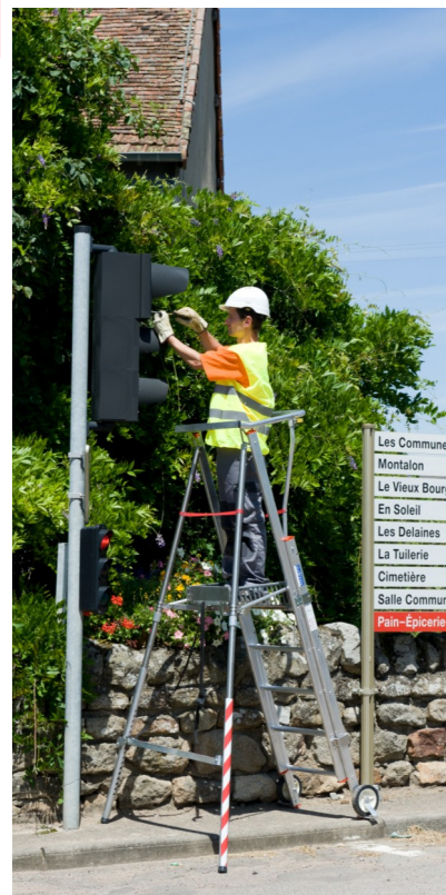
Version Polyvalente 302021