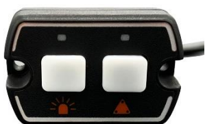
Boîtier de commande