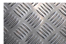
Plancher tôle damier en aluminium