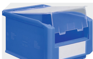
Couvercle fermeture complète pour bacs à bec, série SK l 71 x l 97/76 mm 2-19545