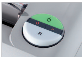
Commande électronique multi-fonctions EASY-SWITCH