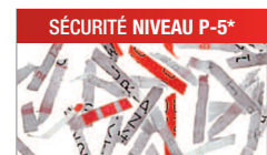
Modèle C/C - 2x15 mm Pour les documents confidentiels ou secrets.