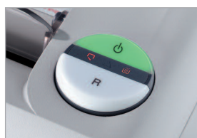
Commande électronique multi-fonctions EASY-SWITCH

Modèle C/F - 4 mm Pour les documents internes.