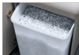
Réceptacle pratique avec poignée de préhension