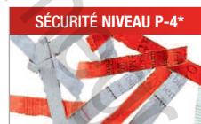
Modèle C/C - 4x40 mm Pour les documents confidentiels.