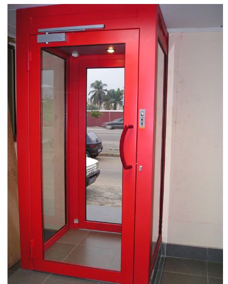
Modèle déposé - Copyright © Globale Protection. Tous droits réservés.

La structure métallique traitée anti-corrosion par un revêtement époxy à 60µm est garantie 5 ans .