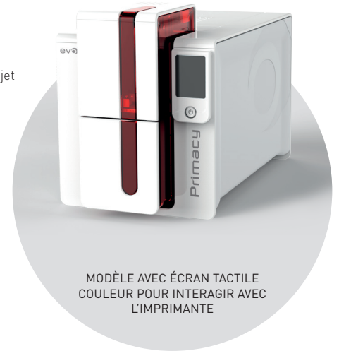
MODÈLE AVEC ÉCRAN TACTILE COULEUR POUR INTERAGIR AVEC L'IMPRIMANTE