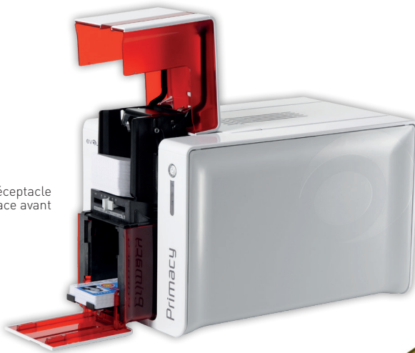
Chargeur et réceptacle en face avant