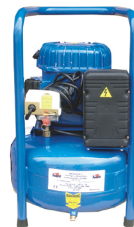
Option : Compresseur

Ce kit permet d'enfiler les produits de toutes les tailles pour des impressions au dos des polos, chemises, sur manches courtes ou longues, sur des jambes de pantalons ou shorts, sur des vêtements de travail, sur de la bagagerie (sacs à dos, sacs de sport, parapluies, ...)