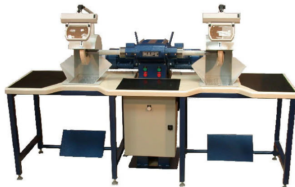
Polissoir Baby sur Table