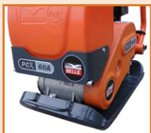
Rampe d'arrosage avec capot de protection métal