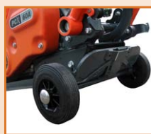
Kit de roues surbaissés amovible en option