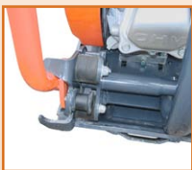
Vérrou de blocage du timon