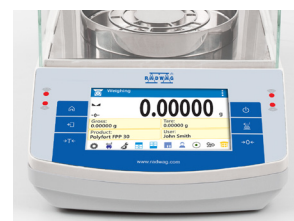
Écran tactile 5" personnalisé à l'aide de widgets