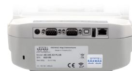
Interfaces de communication