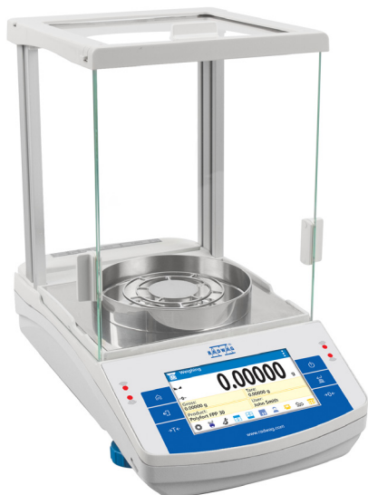
AS.X2 PLUS, d = 0,01 mg

Niveau de mesure avancé, confort d'utilisation maximal et de nombreuses possibilités de personnalisation d'écran