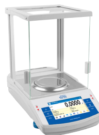
AS.X2 PLUS, d = 0,1 mg