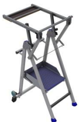
PIRL 2 RM