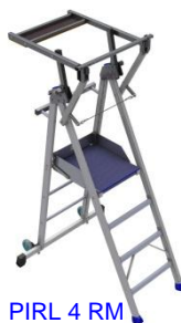
PIRL 4 RM