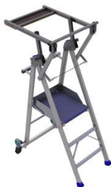
PIRL 3 RM