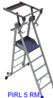
PIRL 5 RM