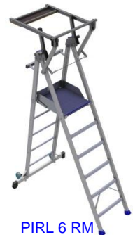
PIRL 6 RM