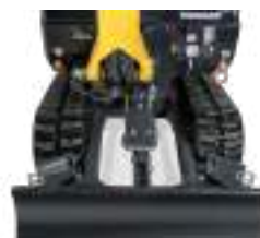
Châssis rétracté : 980 mm