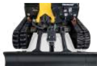
Châssis étendu : 1 320 mm

Afin de minimiser la maintenance et d'éviter l'accumulation de saletés, les pièces coulissantes ont été conçues avec un faible jeu. Stabilité optimale, répartition du poids optimisée, fiabilité idéale.