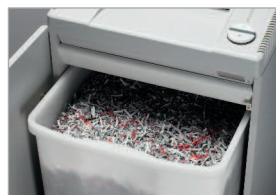
Réceptacle pratique avec poignée de préhension