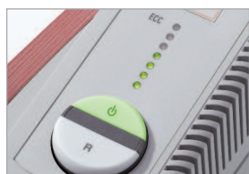
Électronique de Contrôle de Capacité (E.C.C.)