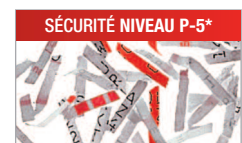
Modèle C/C - 2x15 mm Pour les documents confidentiels ou secrets.