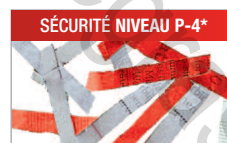
Modèle C/C - 4x40 mm Pour les documents confidentiels.