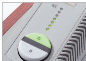
Électronique de Contrôle de Capacité (E.C.C.)