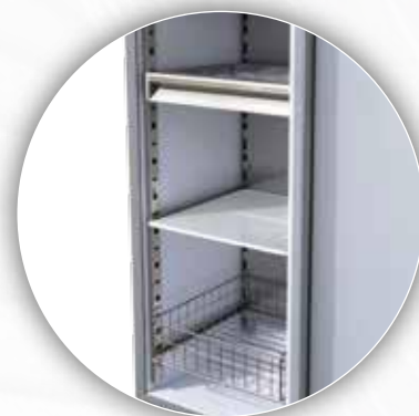
Divers aménagements possibles