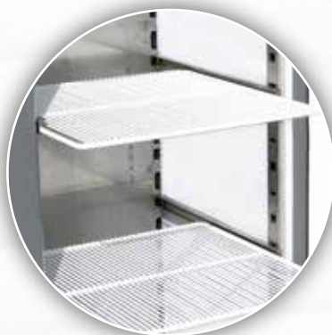
Clayettes en fil d'acier plastifié blanc