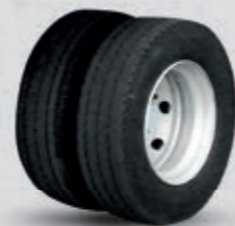
VARIOUS - DIVERS

215/70 R 17.5 235/70 R 17.5 245/70 R 17.5 245/70 R 19.5