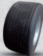
VARIOUS - DIVERS