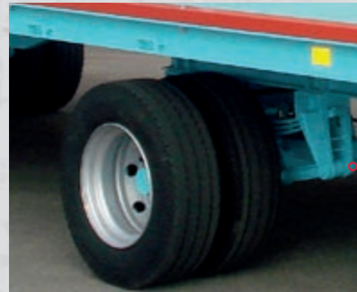
Twin wheels Rous jumelées