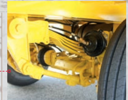
ADR suspensions, 4 leaves, with air braking system Suspensions ADR avec freins à air