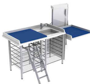
Table à langer électrique 334-083-1