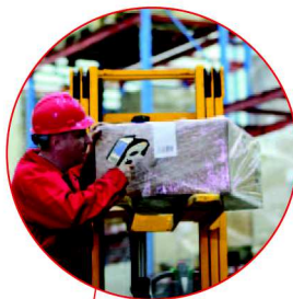
Réception de marchandises