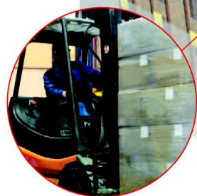
Étiquetage de gondoles