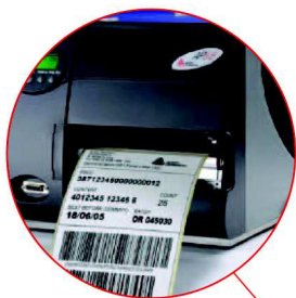
Picking et Préparation de commandes