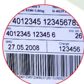
Étiquetage des cartons et des palettes