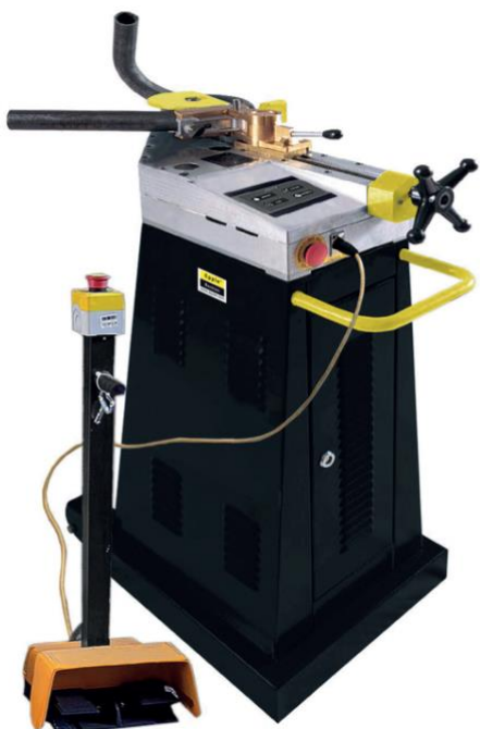
PIC: E-MRB 42