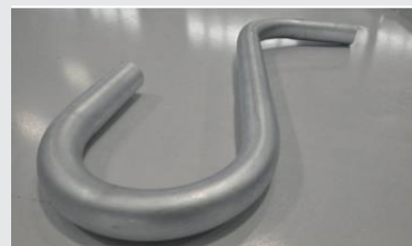
FIG : Exemple d'application