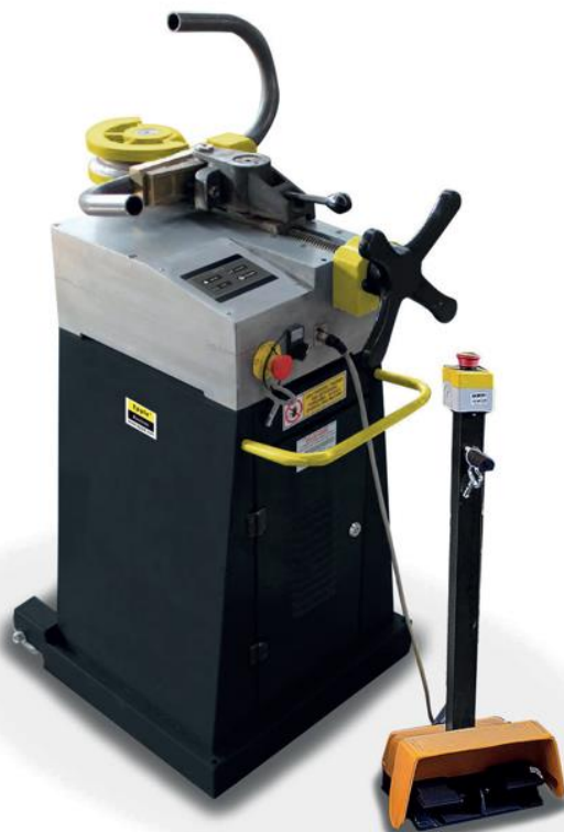
PIC: E-MRB 60