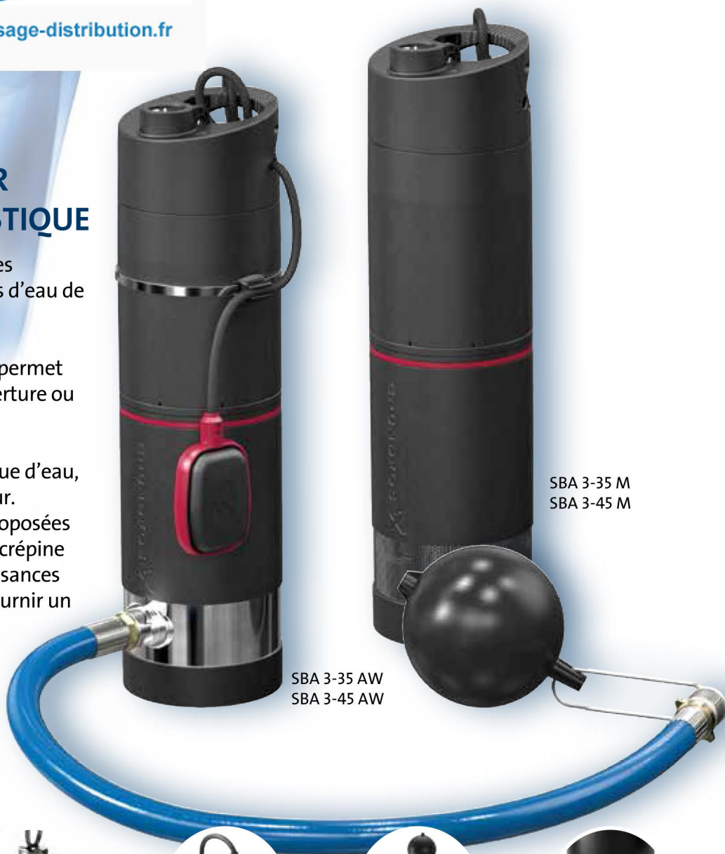
SBA 3-35 M SBA 3-45 M

Livrées avec 15 m de câble et prise, les pompes immergées SBA sont prêtes à être installées et aucun accessoire complémentaire n'est nécessaire pour qu'elles puissent fonctionner.