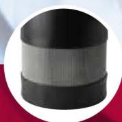
SBA 3-35 AW SBA 3-45 AW