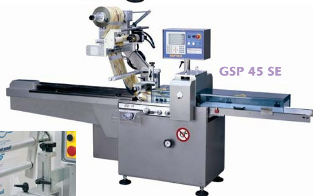
GSP 45 SE