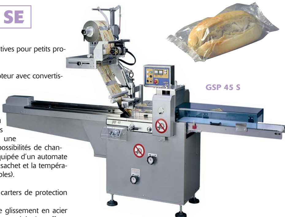
GSP 45 S