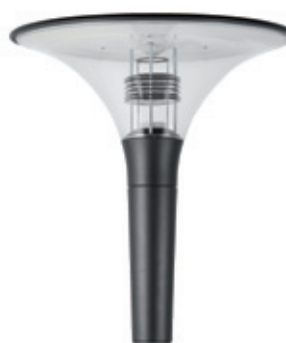
Vasque transparente Transparent diffuser