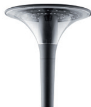
Version LED LED Version