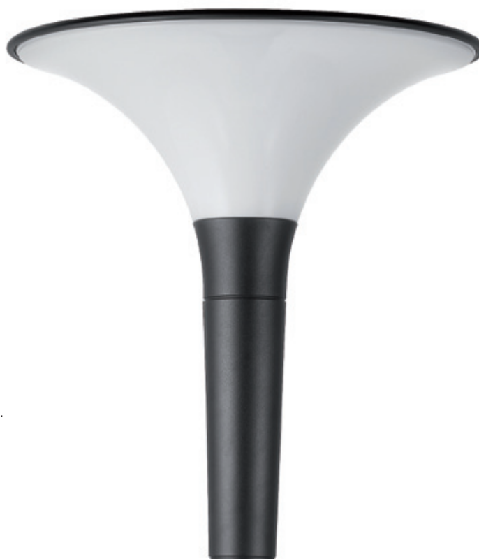
Vasque opale Opal diffuser

La solution pour les zones piétonnes et les jardins publics.