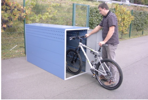
1 cabine seule

Livraison en kit à assembler avec notice de montage dessinée.