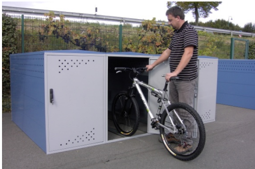
Plusieurs cabines accolées