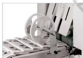
Sortie étagée motorisée

Adaptée aux travaux intensifs, cette agrafeuse-plieruse automatique taque, agrafe et plie tout document issu d'une impression numérique ou offset et ce d'un format inférieur au format CD jusqu'au A3+.