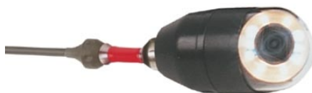
Tête de caméra ROTATIVE pan (360°) tilt (180°) (Ø 51mm) (avec pochette)