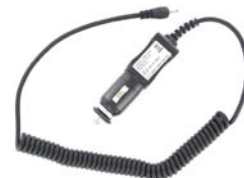
Adaptateur 12V (pour connexion sur allume cigare)