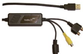
Convertisseur Video PC USB Permet de connecter l'écran à un PC (portable ou de bureau)