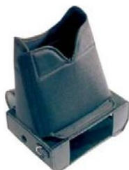
Protection anti éblouissement (pour écran)