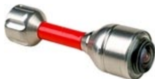
Mini caméra (Ø de 26mm)