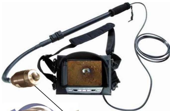
Shaftcam 360 :

sa petite taille (Ø 26mm), permet d'explorer tous les recoins d'une cavité, d'un faux plafond ou de tout autre endroit !