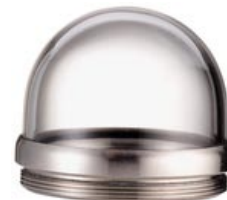
Dôme en verre pour caméra pan tilt (Ø 51mm)