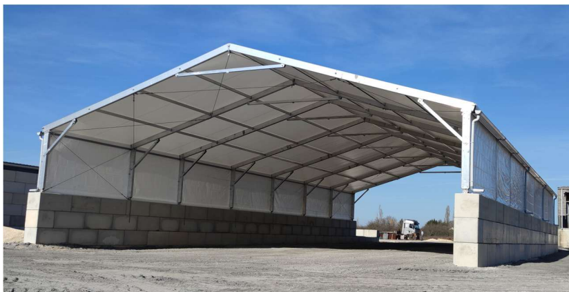
Bâtiment de stockage vrac (89 VILLIERS SAINT BENOIT)