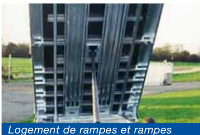
Logement de rampes et rampes