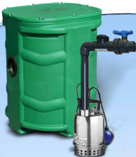
SANIDRAIN 250 VERSION KIT DE CONNEXION