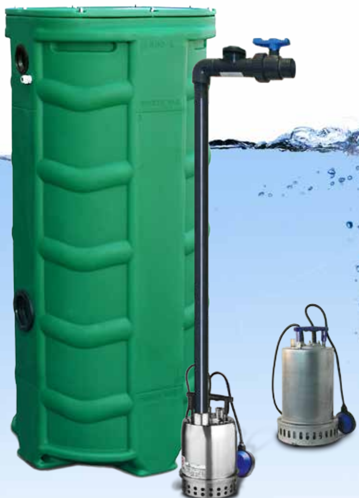
SANIDRAIN 500V VERSION KIT DE CONNEXION