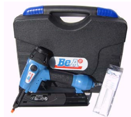
Livré dans sa mallette avec 3000 pointes