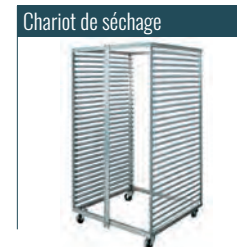
Chariot inox à roulettes pour ST4 à ST6-100