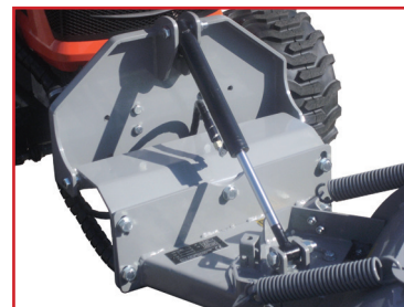
Relevage hydraulique (en option)