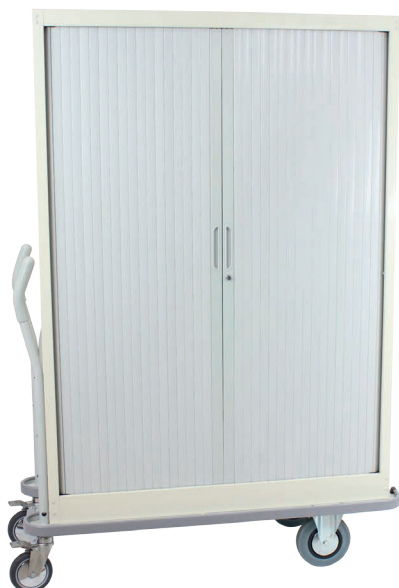
Armoire mobile de transfert