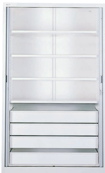
Armoire à solutés