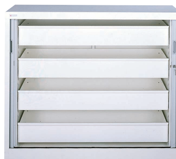
Armoire petit modèle