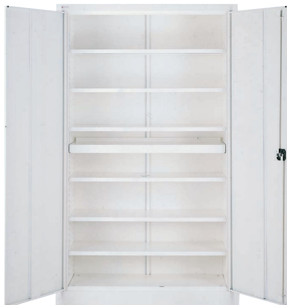
Armoire à portes battantes