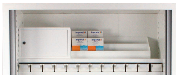
Gradin 3 niveaux et coffre à toxique