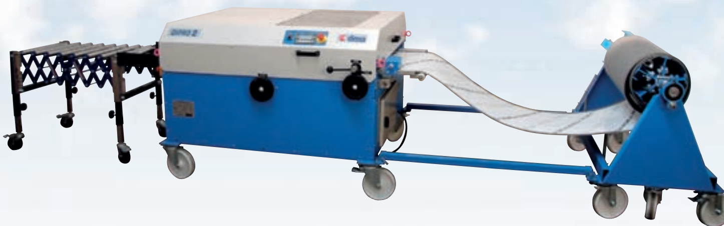
Atelier profilage présenté avec la profileuse DIPRO-2