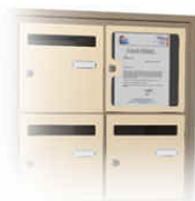
Tableau d'affichage intégré dans le bloc. (occupe 1 case du bloc)