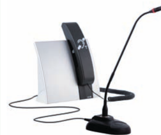
« LA-90 Set » réf. A-4211-0

Le « LA-90 Set » comprend le « LA-90 », un microphone de table, un combiné et un insert de montage pour le combiné.