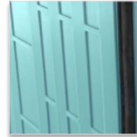
Joint d'étanchéité EPDM en cadre monobloc