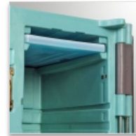
Support plaque eutectique venant de moulage