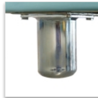
4 pieds métalliques Ø 60 mm