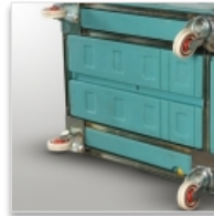
Châssis encastré, acier anti-corrosion, - 2 roues fixes - 2 roues pivotantes Ø 100 mm