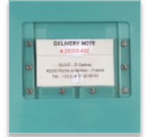
Porte étiquette encastré