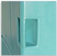
2 poignées de manutention venant de moulage