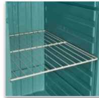
1 à 3 grilles acier rilsanisé