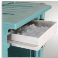
Tiroir à glace carbonique