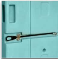
Système d'arrêt de porte ouverte à mi-hauteur