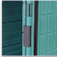
Articulation caisse/porte à double axe. Porte à ouverture 270°