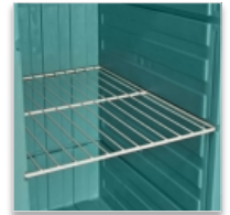
1 à 3 grilles acier inox