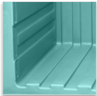
Rotomoulage monobloc. Rainurages intérieurs de convection