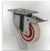
2 roues à frein Ø 100 mm