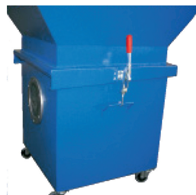
► Seau de récupération avec hublot et raccordement rapide