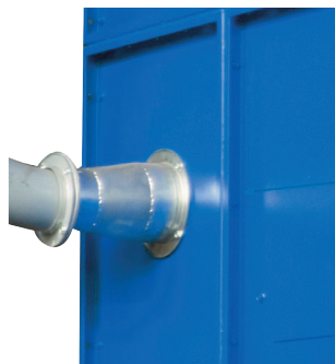
► Entrée d'air en caisson de détente pour une meilleure pré-séparation