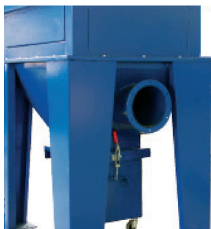
► Entrée d'air directe en trémie