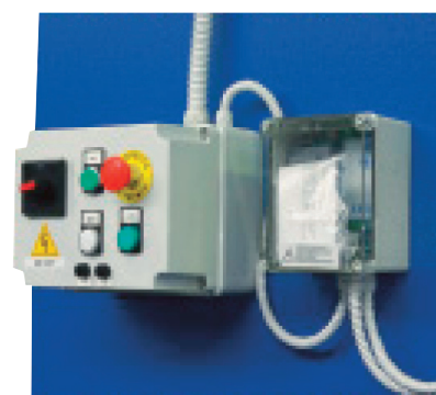
► Séquenceur et armoire de commande (en option)