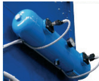
► Réservoir d'air comprimé avec manomètre