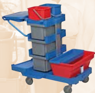
CHARIOT LIVRE SANS SAC (à commander séparément)