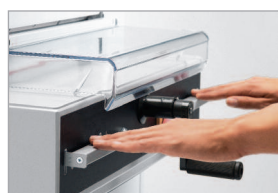
Commande bi-manuelle EASY-CUT