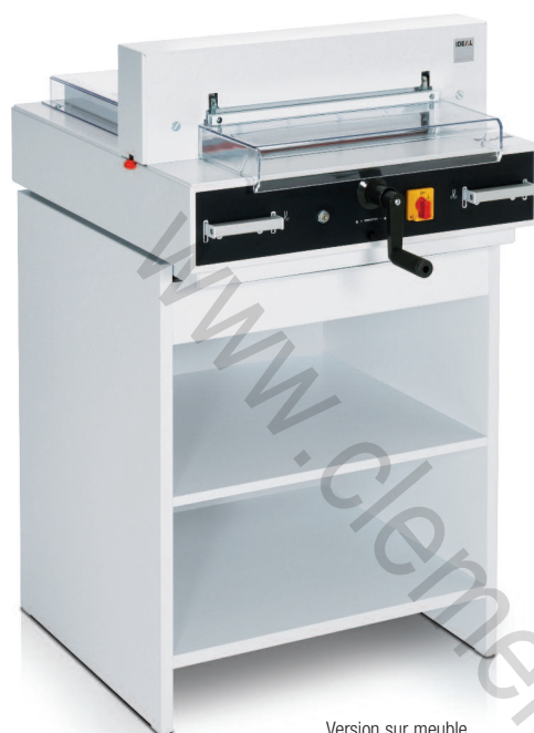
Version sur meuble